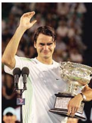
Federer triumfoval v Melbourne s. 15