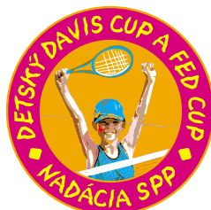
Doprajme deťom radosť z tenisu s. 10