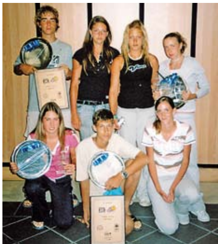
Juniori zbierali trofeje v Južnej Amerike s. 42, 43