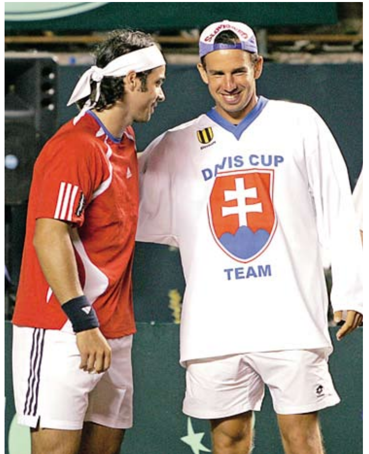
Jednotky tímov v priateľskom rozhovore - zľava Fernando GONZÁLEZ a Dominik HRBATÝ