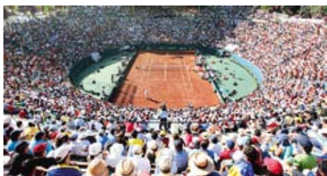
Davisov pohár: Čile - Slovensko 4:1 s. 2, 3, 4, 5