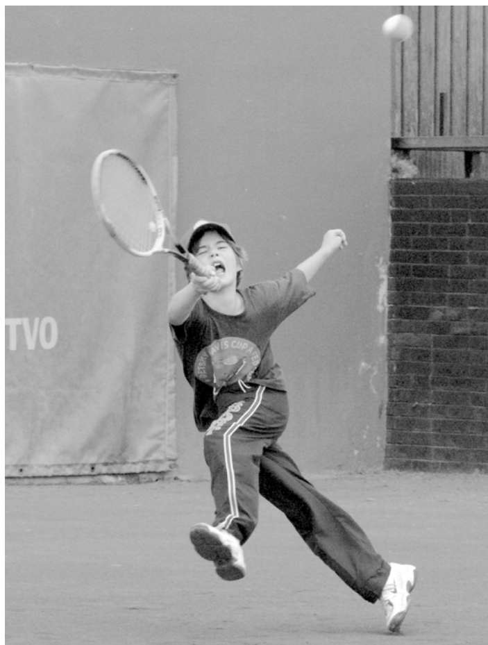
Današová: ... a nedám zadarmo ani jeden fiftín!

STZ bude priebežne vydávať na svojej internetovej stránke všetky pokyny, súvisiace s projektom „Detský Davis Cup a FED Cup s Nadáciou SPP“. Pôjde najmä o podmienky pre subjekty, ktoré majú záujem zúčastniť sa na projekte, formu-