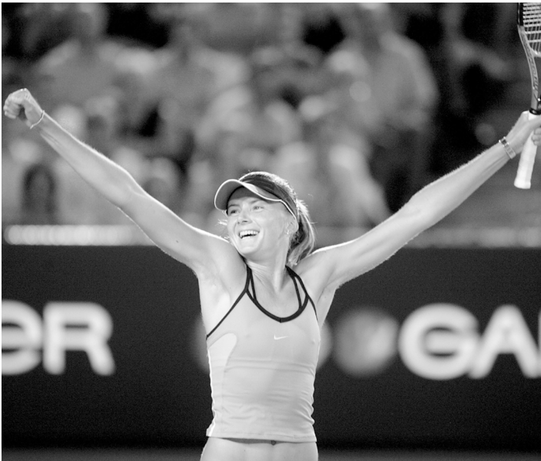
Daniela HANTUCHOVÁ má radosť z víťazstva nad Serenou Williamsovou