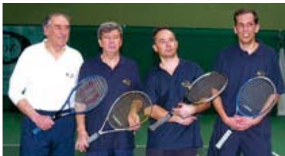
0 turnaji veľvyslancov