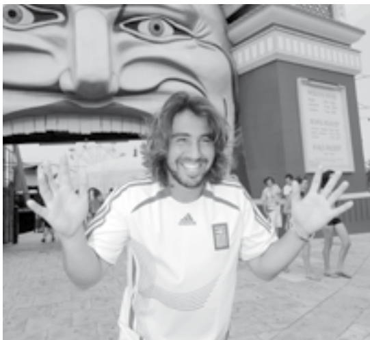
Marcos BAGHDATIS sa môže tešiť - na vojnu musí ísť až o 12 rokov

tenisom ešte baviť, chcela by som hrať celý rok,“ povedala. V decembri podstúpila artroskopiu kolena. Zranenie sa jej prihodilo v novembri počas exhibície, ale už je opäť fit, začala hrať a plánovať si program. V máji sa na ňu môžu tešiť diváci v Prahe – prisľúbila účasť na Prague Open. Deväťnásobná wimbledonská šampiónka si na Štvanici zahrála už exhibične, ale súťažný zápas tam odohrala naposledy roku 1986 vo finále Pohára federácie v tíme USA proti Československu. Bývalá svetová jednotka vtedy prišla do rodnej krajiny prvý raz po 11 rokoch od svojej emigrácie roku 1975. „Chcela som hrať za Československo i Ameriku,“ líčila Navrátilová s odstupom času svoje vtedajšie pocity. Od roku 1981 reprezentuje USA, v dlhej kariére získala 58 grandslamových titulov a ak sa dostane opäť do formy, nepochybne bude chcieť vo štvorhre, najmä mixe, siahať v tomto roku po ďalšom.