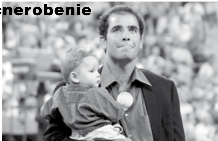
Takto, so synom na rukách, sa lúčil Pete SAMPRAS na US Open 2003

úrovni, je to veľká drina,“ vraví Sampras. Na dvorce sa vráti po troch rokoch od pamätnej rozlúčky na US Open 2003. Rok predtým odohral svoj posledný zápas práve vo Flushing Meadows. Vo finále zdolal Agassiho a získal svoj 14. titul z veľkej štvorky. Teraz má Sampras 34 rokov, je šťastne ženatý, má dve deti. „Trochu som sa nudil, začal som rozmyšľať ako ďalej v živote. Zatiaľ som sa rozhodol opäť vrátiť do tejto súťaže a hrať pred divákmi,“ vraví. Základná časť World Team Tennis Pro League sa hrá 6. - 26. júla.