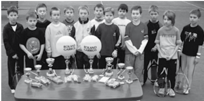
Boďaj by vydržalo čo najviac týchto chlapcov pri tenise a zbierali podobné pekné trofeje ďalej

Aj v tomto roku usporiadal agilný tenisový klub Mladost' Košice zimný tenisový turnaj detí do 9 rokov. Sme veľmi radi, že naša výzva z minulej zimy našla odozvu a našli sa ďalší ochotní organizátori takýchto turnajov. Na druhej strane je smutné, že na týchto turnajoch sa zúčastňuje čím ďalej tým menej detí, čo asi svedčí o slabej práci v tenisových kluboch na Slovensku.