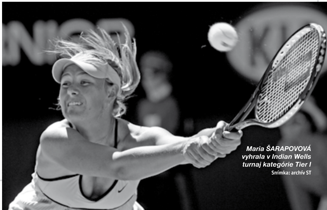
Maria ŠARAPOVÁ vyhrala v Indian Wells turnaj kategórie Tier I

Štvrťfinále: Hardenová (1-Bel.) – Dulková (17-Arg.) 63, 62, Dementievová (4-Rus.) – Ivanovičová (8-SaČH) 26, 64, 62, Šarapovová (3-Rus.) – Grönefeldová (7-Nem.) 61, 63, Hingisová (19-Švajč.) – Saffinová (10-Rus.) 63, 64, semifinále: Dementievová – Hardenová 26, 75, 75, Šarapovová – Hingisová 63, 63, finále: Šarapovová – Dementievová 61, 62.