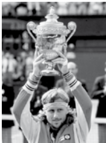
Björn BORG s jednou zo svojich vzácných wimbledonských trofejí

Björn Borg bude mať v júni 50 rokov, ale okrem oslavy narodenín aj jednu nie veľmi potešiteľnú udalosť: rozhodol sa predajť na aukcii všetkých päť trofejí za víťazstvá vo Wimbledon, ktoré získal v rokoch 1976-80. Legendárny Švéd sa ocitol vo finančnej tiesni a podľa švédskych médií potrebuje peniaze ako zábezpeku pre ľudí zo svojho okolia, na ktorých mu záleží.