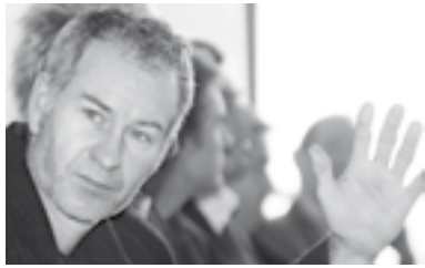
John McENROE a Martina NAVRÁTILOVÁ, dve legendy, ktoré ešte stále hrajú - a vyhrávajú

Americký búrlivák John McEnroe nehral 12 rokov na okruhu ATP, ale v San Jose si trúfol, hoci nastupoval s malou dušičkou. „Myslel som si, že prehrám v prvom kole. Ale aj to, že celý turnaj vyhrám,“ priznal McEnroe v San Jose, kde rozšíril svoju zbierku po 15 rokoch odvtedy, čo naposledy s bratom Patrickom získala prvenstvo v Paríži. „Tarcha ležala na Jonasovi,“ s uznaním povedal John na adresu svojho Švédskeho partnera, ktorý už tiež nie je mladík – Björkman má 34 rokov. McEnroe bol, pochopiteľne, pomalší ako