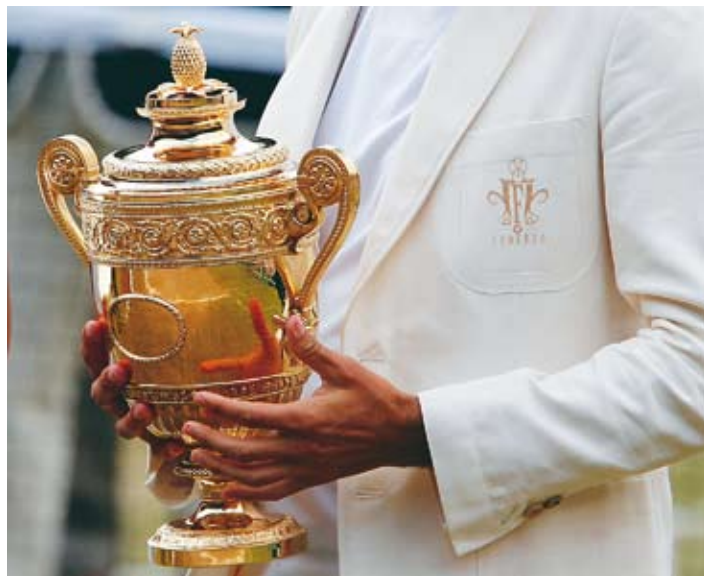
Pred rokom: špeciálne sako Federera s wimbledonskou trofejou. Na kresbách NADAL a FEDERER, svetová dvojka a jednotka.

ti. Ale napokon aj konzervatívny Wimbledon pristúpil na to, čo je už zavedené na ďalších grandslamových turnajoch.