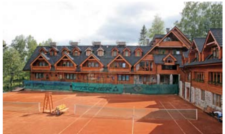
Penzión - pohľad na vnútorný dvor Teniscentra SIMI