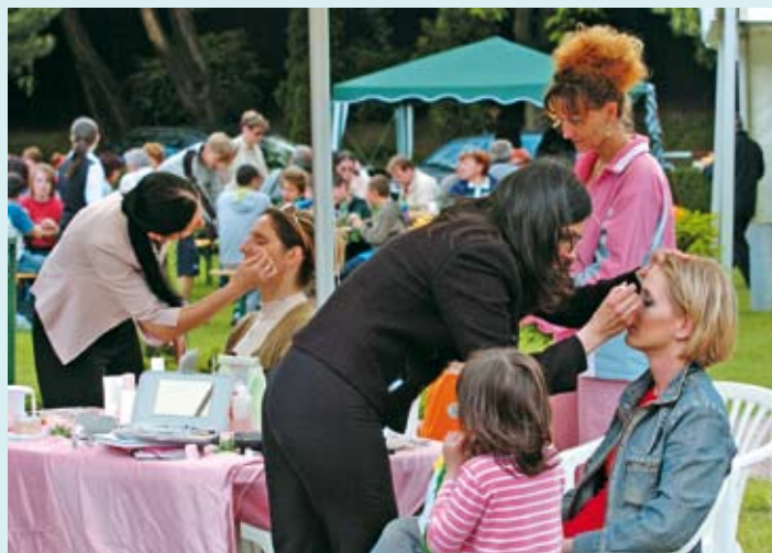
Vizážistky v plnom nasadení