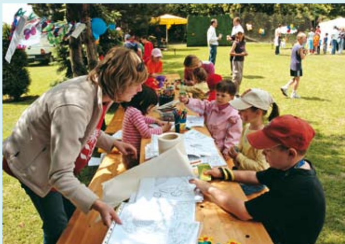
Toľko umelcov na jednej kope ťažko ešte niekde nájsť!

Detičky to brali ako samozrejmosť, a sústredene bojovali o každú loptičku. No dospelákom to akosi nešlo do hlavy, že lopta priam ideálne nahaná na smech, neskončila z ich rakety nechytateľne v poli súpera, ale takmer na špiči ich tenisiky, a tak sem tam šmarili raketu do zeme a nadávali si do idiotov... No aj tak treba po-