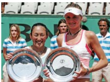
Dvaja Slováci vo finále Roland Garros s. 12, 13