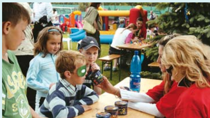
Vieš čo ovoniavaš? Poriadne si čuchni!