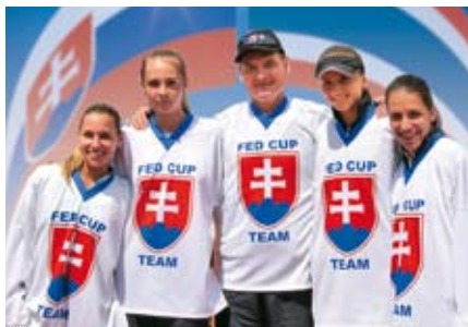
Príďte povzbudiť na Pohár federácie s. 7