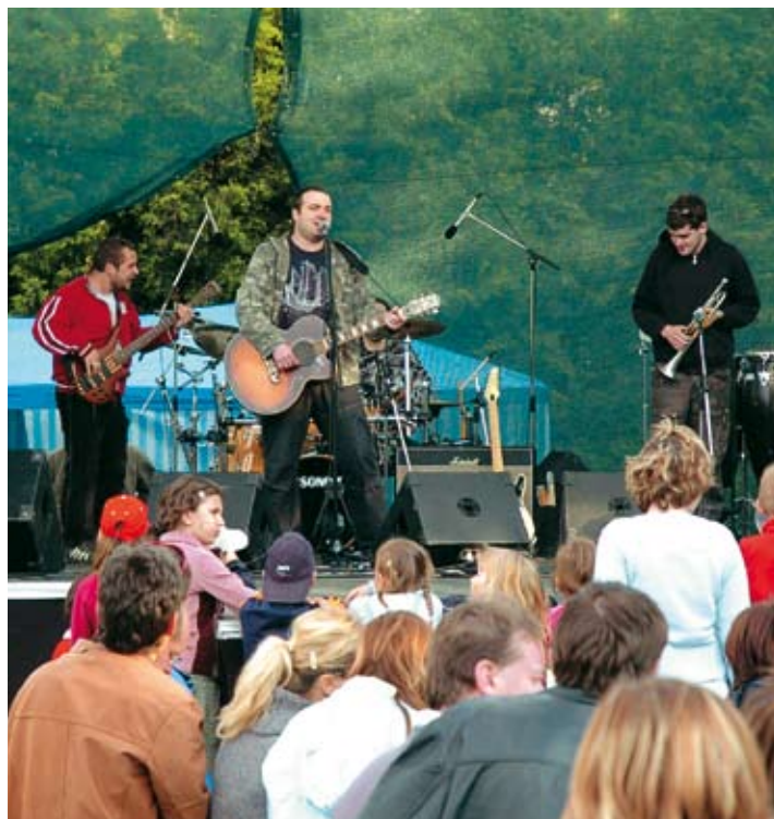
Aj kapela IMT Smile u obecnstva zabodovala