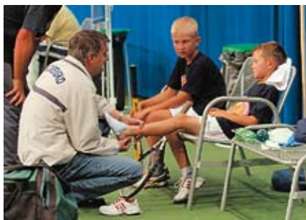
Hrajme tenis lepšie s. 23 - 26