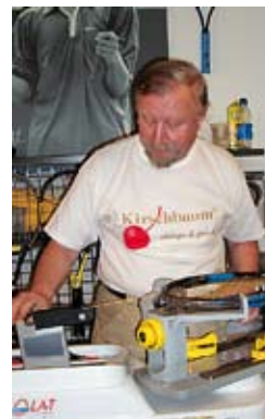
Diagnóza rakety s. 16