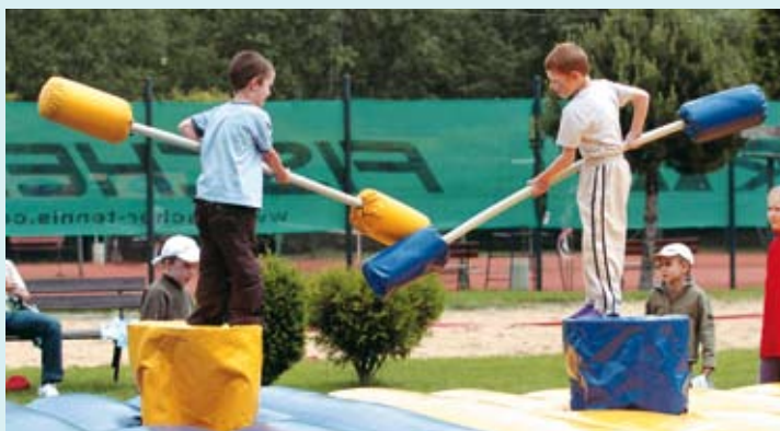
Gladiátori si tiež prišli na svoje