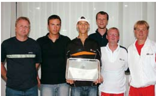
Tréneri v NTC sa tešia s Klišanom s. 5