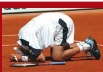
Radosť po víťazstve