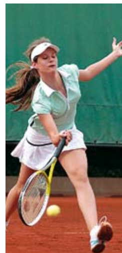
Žiactvo a dorast o majstrovské tituly s. 17, 18, 19, 28