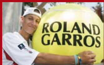
Snímka na pamiatku