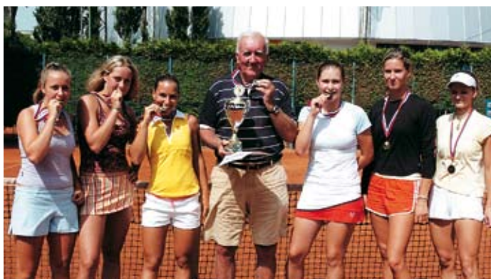
Extraliga: majstri obhájili s. 30, 31