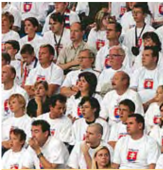
V Sibamac aréne Davis Cup Slovensko - Belgicko s. 2, 3