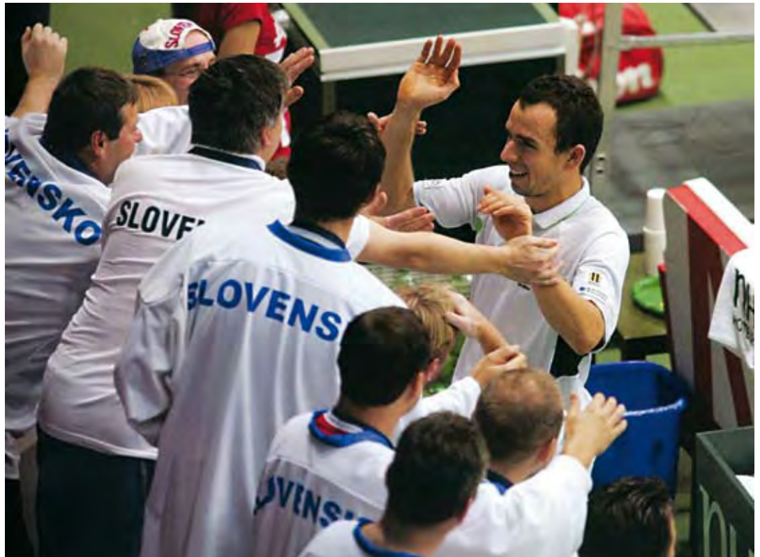
Slovenská lavička opäť ožije a Dominik HRBATÝ bude znova veľkou oporou tímu

favoritmi. Ale my máme Hrbatého! Tímového hráča, ktorý v Davisovom pohári nikdy nesklamal a vždy vydoloval zo seba, najmä v domácom prostredí, maximum. Ak bude fit a mať formu, pokúsi sa udržať so svojimi spoluhráčmi Slovensko medzi elitou. Mečírův tím bude potrebovať podporu svojich fanúšikov, podobne ako vlni, keď v Sibamac aréne vyradil Španielsko s Na-