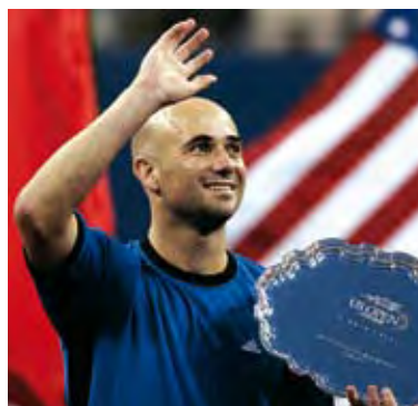
Agassi sa na US Open lúči s. 29