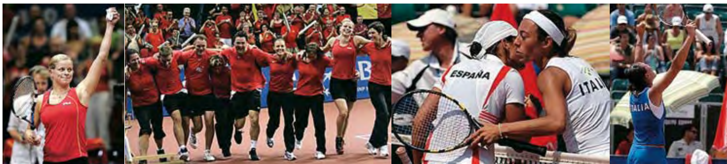
Radosť finalistov: Kim Clijsterová a belgický tím po postupe do finále, Schiavoneová (vpravo) a Pennettová, strojkyne talianskeho postupu