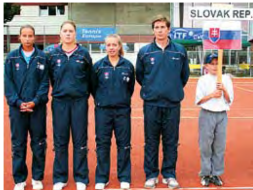
Slovenky postúpili na MS s. 17