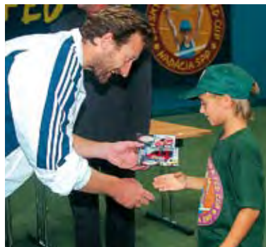
Detský Davis Cup a Fed Cup s Nadáciou SPP s. 27