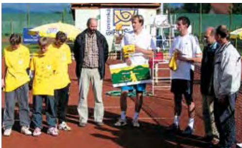
Žilina Open: Slovák vo finále s. 12

Slovensko spozná 15. septembra súpera s. 4