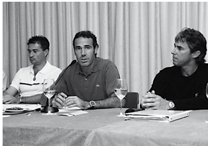
Vzdelávacie fórum: uprostred Alex CORRETJA

ganizácii tenisového turnaja olympijských hier, organizujú školenia trénerov, vysielajú svojich pracovníkov do historicky menej tenisovo známych oblastí (momentálne najviac do Číny, kde sa snažia v pred-olympijskom období zintenzívniť spoluprácu s čínskou tenisovou federáciou), majú vytvorený podporný tím