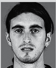
Potito STARACE (Taliansko)