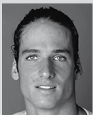
Feliciano LOPEZ (španielsko)