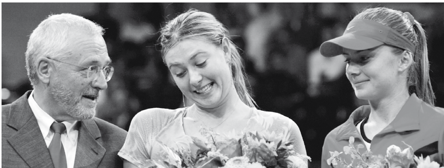
Dekorácia po zürišskom finále - víťazka Maria ŠARAPOVÁ a finalistka Daniela HANTUCHOVÁ