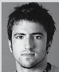
Janko TIPSAREVIČ (srbsko)