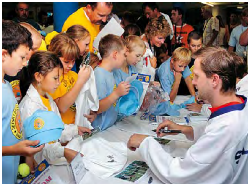
O autogramiádu našich tenistov bol obrovský záujem