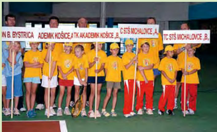
Východniari na jednej kope...