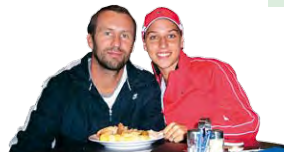
Rozhovor s Dominikou Cibulkovou s. 18