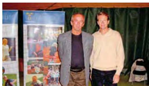
Stefan Edberg rozprával o svojej kariére s. 23