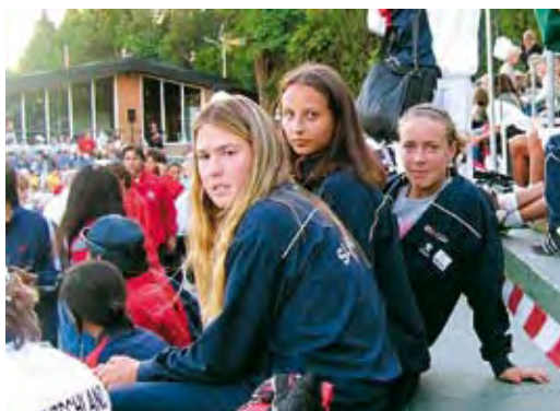
V Barcelone naše juniorky bronzové s. 12, 13