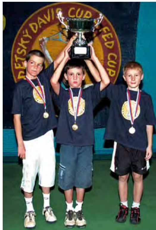
Víťzné tímy chlapcov a dievčat Slávie Právník Bratislava