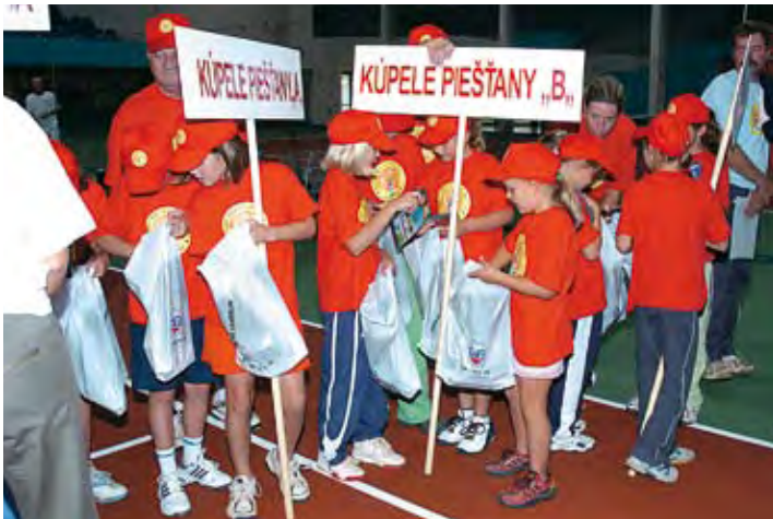
Piešťanci lovia v sáčkoch s darčekmi...