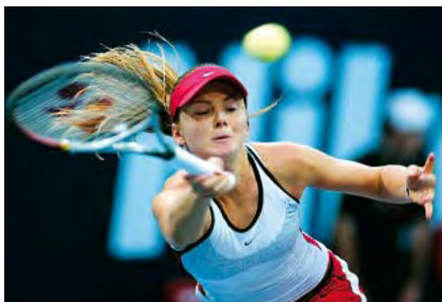
Daniela Hantuchová v Zürichu vo finále s. 19