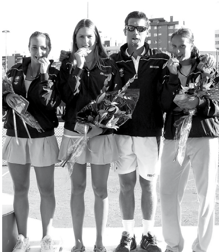
Na stupni víťazov