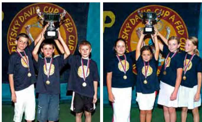
Detský Davis Cup a Fed Cup vyhrali tímy Slávie Právník s. 2