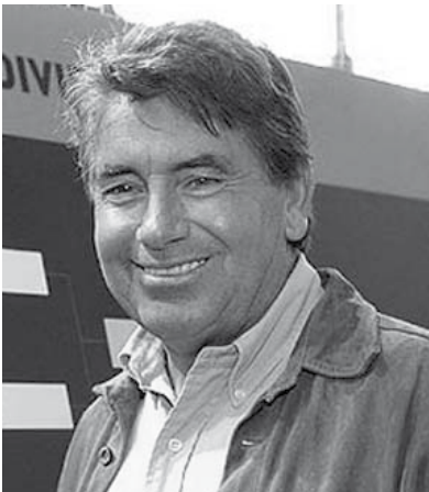
Riaditeľ turnaja MS WTA Tour v Madridi Manolo SANTANA

Pozoruhodné je, že medzi singlistkami bude v Madridi chýbať zastúpenie USA. Capriatiová už nehrá, Davenportová, ktorá bola ešte pred rokom v Los Angeles, mala časté absencie, na ústupe sú i sestry Williamsové.