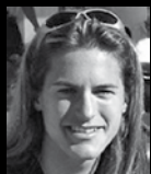
Francúzsko Amélie Mauresmová