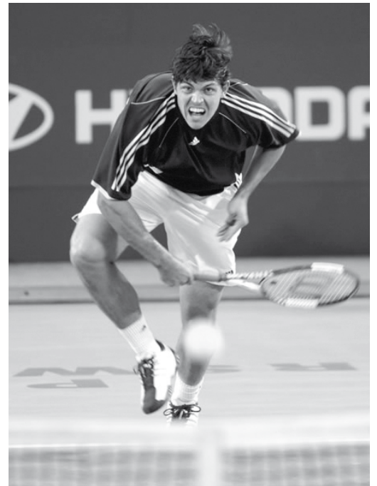
Taylor DENT príde do Perthu obhajovať prvenstvo

Španielsko: Medinová-Garriquesová, Robredo, Česká republika: Šafářová, Berdych, Chorvátsko: Ančičová, Ančič, Víťaz ázijskej kvalifikácie