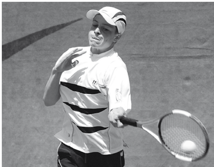
Snímky: Dušan BARUŠ (2), Tenis