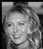
Rusko Maria Šarapovová