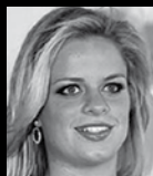
Belgicko Kim Clijstersová