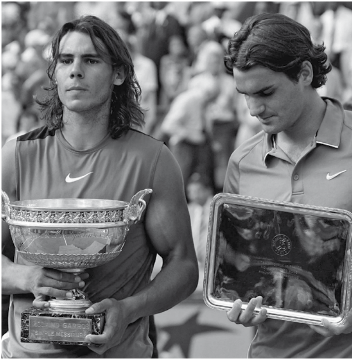
Rafael NADAL a Roger FEDERER, dvaja veľkí rivali, takto stáli vedľa seba po finále Roland Garros 2006