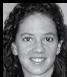
Svajčiarsko Patty Schnyderová