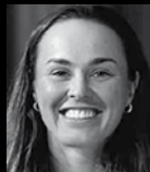
Svajčiarsko Martina Hingisová