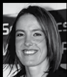
Belgicko Justine Hardenmová

Na majstrovstvách sveta WTA Tour obhajaie titul svetová jednotka Francúzka Amélie Mauresmová