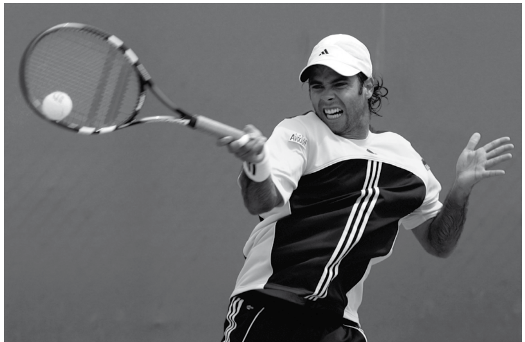
Fernando GONZÁLEZ usilovne finišoval - bol vo finále v Madride aj Bazileji, ale na Masters v Šanghaji sa dostal len v úlohe náhradníka

2. kolo: Hrbatý (17) – Andrejev (Rus.) 63, 64, 3. kolo: Hrbatý – Murray (13-V.Brit.) 76(6), 60, štvrťfinále: Robredo (6-Šp.) – Nieminen (14-Fín.) 67(4), 76(4), 64, Davydenko (4-Rus.) – Ančič (9-Chorv.) 63, 63, Hrbatý – Berdych (8-ČR) 64, 16, 62, Haas (10-Nem.) – Safin (Rus.) 76(1), 36, 63, semifinále: Davydenko – Robredo 63, 57, 62, Hrbatý – Haas 64, 10 ret., finále: Davydenko – Hrbatý 61, 62, 62.