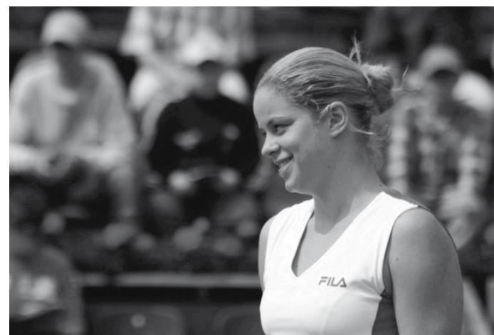
Kim CLIJSTERSOVÁ sa po absencii zavinennej zranením vrátila v Hasselte na okruh - a hneď víťazne