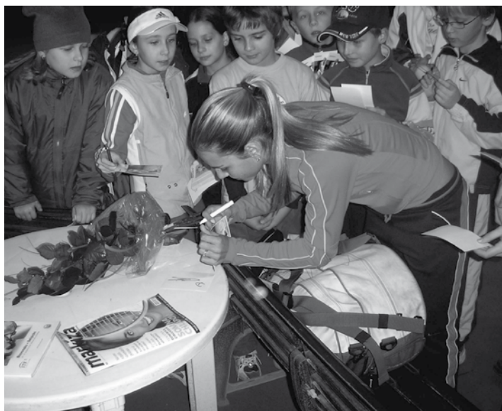
Dominika CIBULKOVÁ rozdáva v Michalovciach autogramy

a) Ceny lôpt sú platné na odber v kartónovom množstve, t.j. 120 lôpt zo skladu Nový Svet 41, 974 00 Banská Bystrica, b) Termín dodávky 48 hodín po objednávke TEN EXPRES a PRIORITY pošta, resp. do 4 dní bežnou poštou (podľa objednávky)