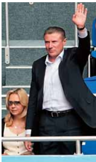
Legendárny Sergej BUBKA v NTC zakýval divákovi, ktorí ho privítali potleskom

„Na bratislavskom mítingu som vytvoril dva svetové rekordy a vždy sa do slovenskej metropoly rád vraciam. Pozriem si štadión, kde som počas aktívnej kariéry veľakrát súťažil a oživím si spomienky, aj keď času nemám veľa,“ naznačil svoje plány na víkendový pobyt v Bratislave. „Mám nabitý program. Čaká ma podpis zmluvy medzi Ukrajinským a Ruským olympijským výborom,“ dodal Bubka, šéf Ukrajinského olympijského výboru. Zo špičkového športovca sa stal popredný športový diplomat. Je členom Medzinárodného olympijského výboru a viceprezidentom IAAF. Z tohto titulu bol nedávno šéfom koordináčnej komisie atletického svetového šampionátu v juhokórejskom Dagu.