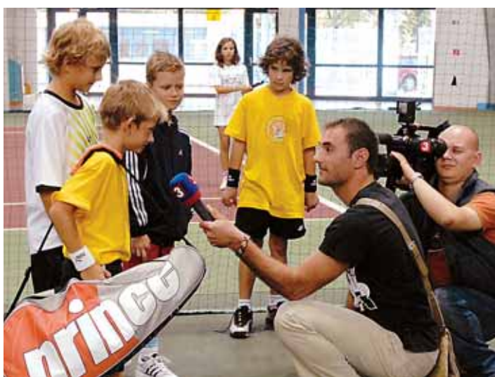
Vítaný košíkový tím chlapcov pred mikrofónom a kamerou