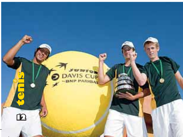
Slovenskí reprezentanti na párty