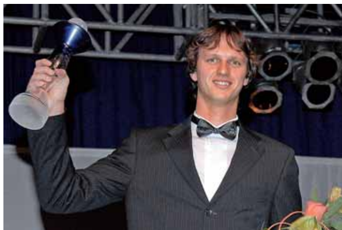
Filip POLÁŠEK, víťaz medzi mužmi

V ankete Slovenského tenisového zväzu o hráčov roka došlo na poste víťazov k striedaniu. Rok 2008 sa v tradičnom hlasovaní niesol v znamení zmien. Premiérovu si prvenstvo vybojovali Filip Polášek a Dominika Cibulková. Víťazstvo hráčky Slovana bolo presvedčivé, najlepší slovenský deblista súperil o priazeň hlasujúcich odborníkov, novinárov a funkcionárov so sedemnásobným víťazom ankety Dominikom Hrbatým. Polášek napokon vyhral o 9 bodov. Cibulková sa stala víťazkou aj čitateľskej ankety mesačníka Tenis o najpopulárnejšieho hráča roka, v ktorej jednoznačne dominovala.