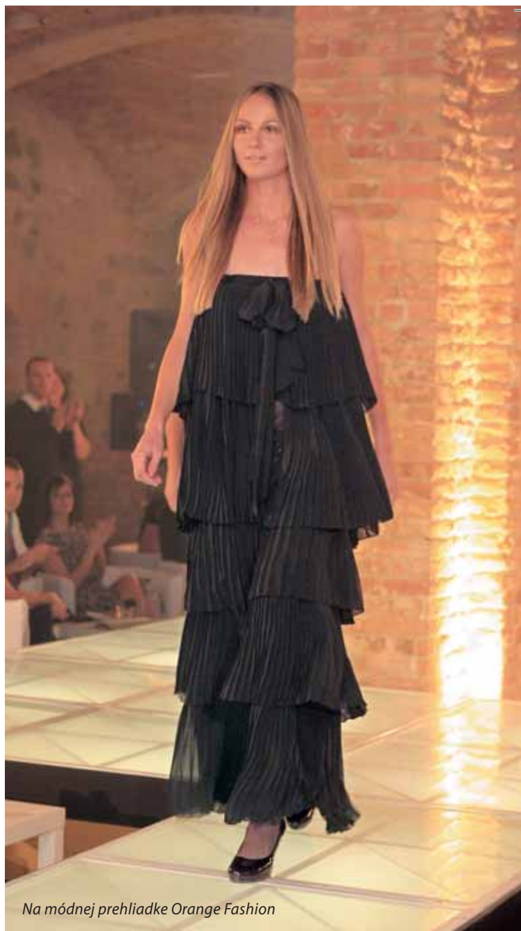
Na módnej prehliadke Orange Fashion