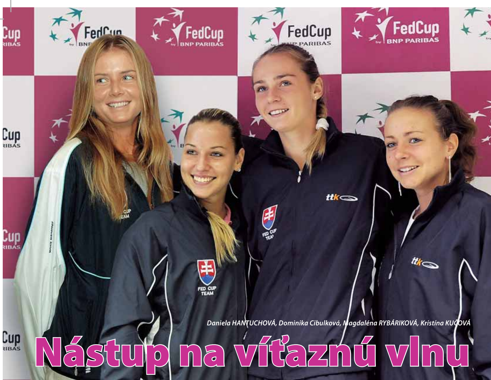
Daniela HANTUCHOVÁ, Dominika Cibulková, Magdaléna RYBÁRIKOVÁ, Kristína KUČOVÁ