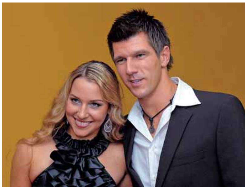
Hviezda večera Domnika CIBULKOVÁ so svojim špeciálnym hosťom, rakúskym tenistom Jürgenom Melzerom, ktorý je priateľom slovenskej jednotky