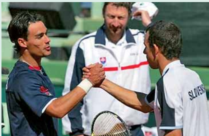
3:1 – FOGGININI rozhodol - vyhral nad HRBATÝM