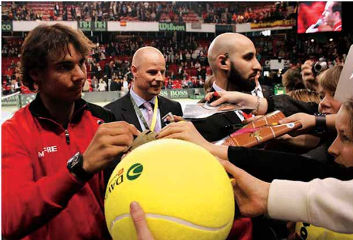
Rafael NADAL, hlavná hviezda v hale SpirouDome, kde na Davis Cupe asistovalo jastrabie oko zo Slovenska