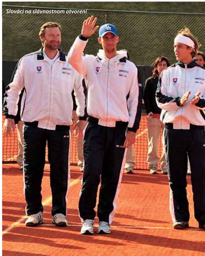
Slováci na slávnostnom otvorení