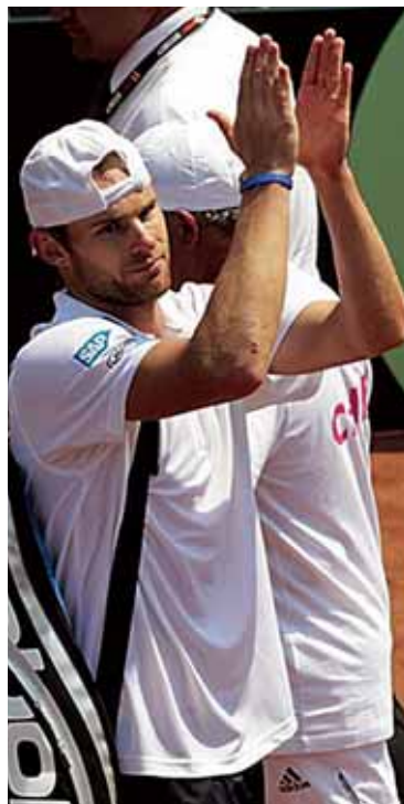
Andy RODDICK slávil v Čile po dvoch rokoch absencie v DC víťazný návrat

Francúzsko, lanský finalista, zamierilo do hangáru 3 schwechat-ského letiska bez svojich troch najlepších - Tsongu, Monfilsa, Gasqueta. Provizórny štadión sa naplnil šiestimi tisíckami fanúšikov Melzera a spol., ale na konci sa radoval galský kohút. Chardy, ktorý sa pol roka na turnajoch hľadá, zdolal Fischera a Francúzsko vylepšilo skóre proti Rakúsku na 8:0.