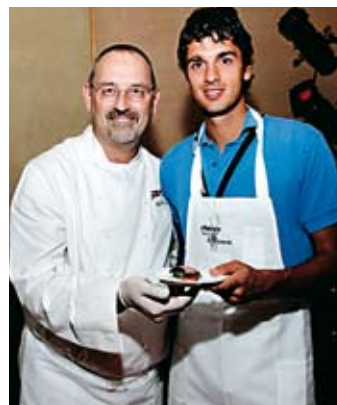
Mario ANČIČ ako kuchár