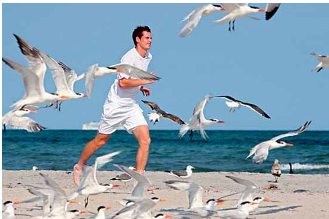
Andy MURRAY si takto užíval v Miami víťazstvo

Na turnajoch získal tie najcenejšie skalpy. V Doha vyradil Federera v semifinále, v Rotterdame vo finále zdolal Nadala, s ktorým však vo vetristom finále v Indian Wells hladko prehral. Výhrou nad Djokovičom v Miami skompletizoval