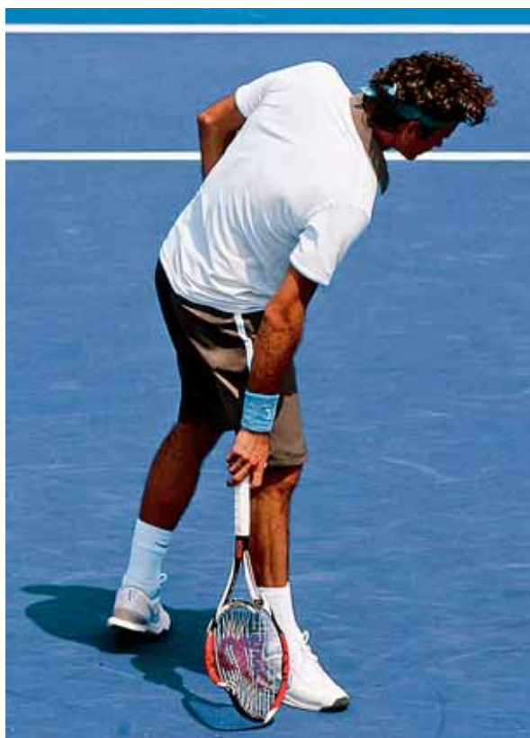
Roger FEDERER s rozlamanou raketou v Miami