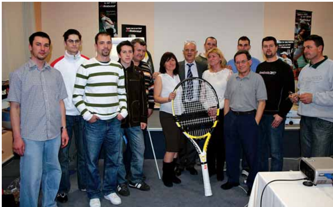
Časť účastníkov banskobystrického seminára