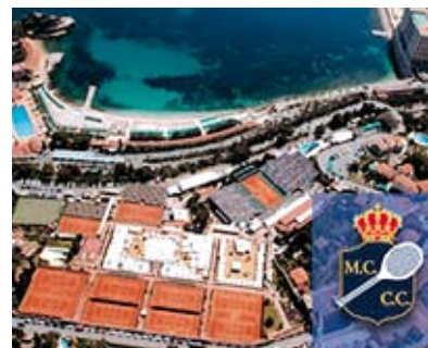
Monte Carlo Country Club