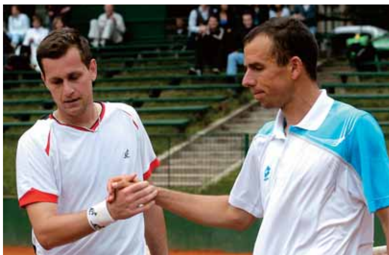
Súboj Karol BECK – Dominik HRBATÝ v semifinále Trnava – Slovan sa vlani i tohto roku skončil víťazstvom Bratislavčana

Na Kližanovi bolo vidieť po víťazstve v tri a polhodinovom zápase spokojnosť: „Som rád, že som Domina v extralige po štrnástich rokoch zdolal práve ja. Sám sebe som dokázal, že na takýchto súperov psychicky a fyzicky mám. S Hrbatým to nie je jednoduché, hrá dlhé výmeny, žiadnu loptu nedá zadarmo. Bol to skvelý zápas a teším sa, že som ho kondične tak dobre zvládol. Priznám sa, bol som chvíľami nervózny, aj raketa lietala, trestný bod som dostal vari prvý raz za ostatných päť rokov... Ale to neriešme, vyhral som a som šťastný,“ jedným dychom komentoval Kližan, ktorého víťazstvo nad bývalým 12. hráčom sveta povzbudilo najmä pred kvalifikáciou Roland Garros.