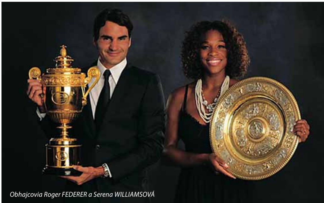
Obhajcovia Roger FEDERER a Serena WILLIAMSOVÁ